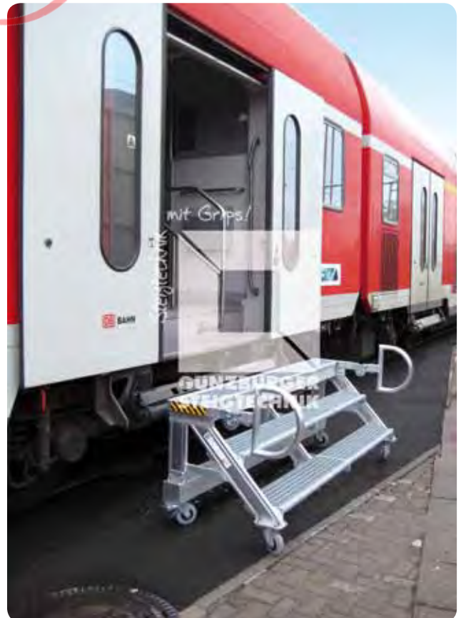
Einstiegspodest ■ Belag Stahl-Gitterrost ■ Fahrbar ■ Handgriffe absenkbar