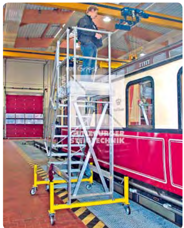
Plattformtreppe ■ Fahrbar ■ Mit höhenverstellbarem Fahrwerk