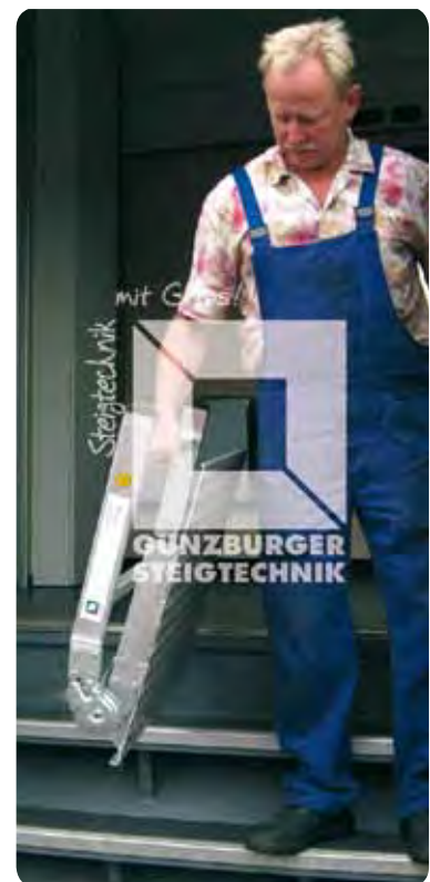
Aluminium-Klappodest ■ Für Zugeinstieg