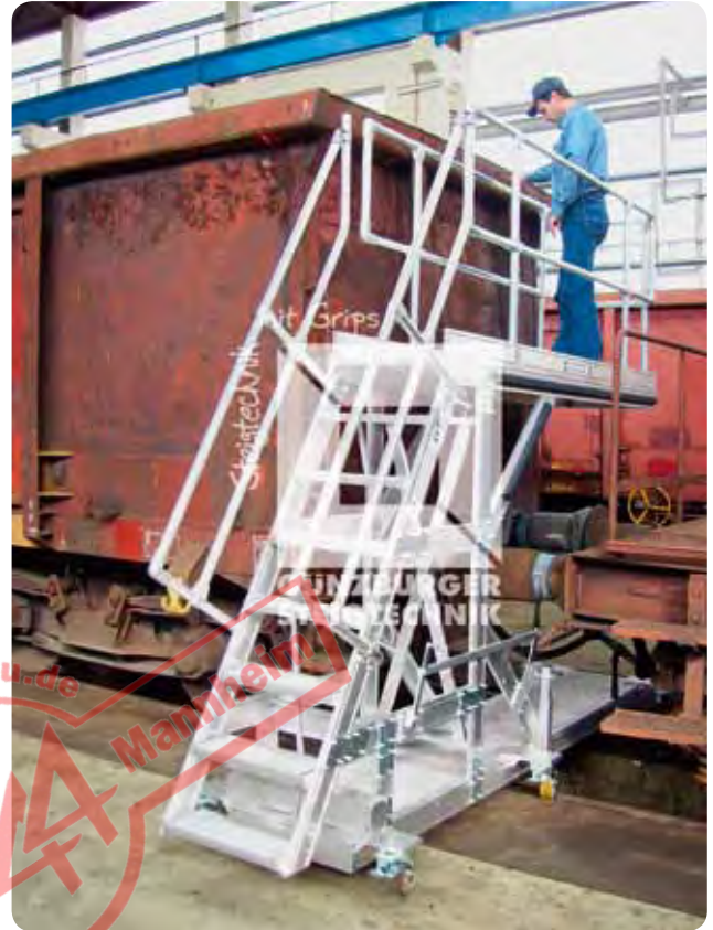
Arbeitsbühne ■ Fahrbar ■ Mit Aufstiegstreppe ■ Zentralhebelfahrwerk