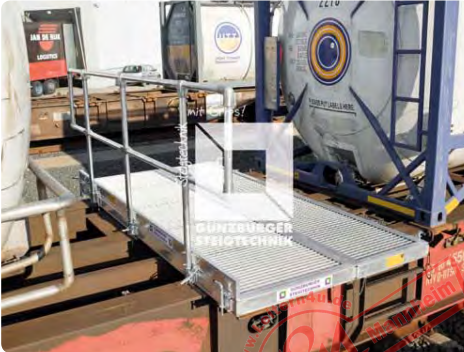
Arbeitsplattform ■ Mit steckbarem Geländer