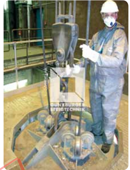
Wartungsbühen ■ Verstrebt ■ Mobil ■ Beide Bühen koppelbar ■ Mit konturangepasstem Wartungsausschnitt