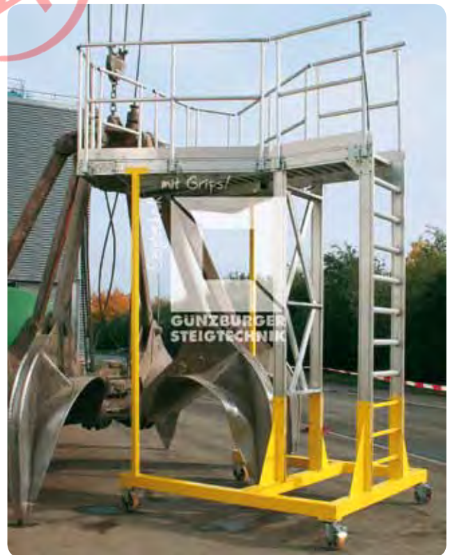
Wartungsbühen ■ Fahrbar ■ Senkrechter Zustieg