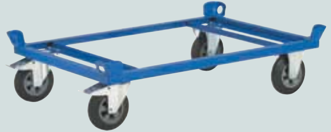
② Fahrgestell 1200 x 800 mm Ladehöhe 270 mm