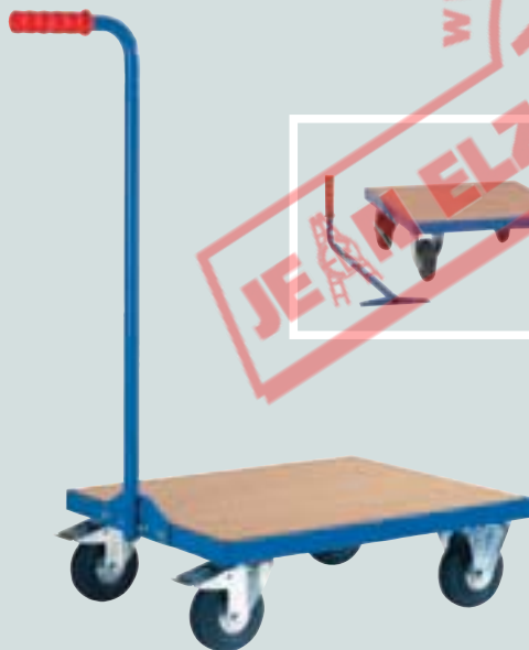
③ Griffroller Schiebegriff anschraubbar