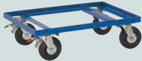
② offener Rahmen 600 x 400 mm und 800 x 600 mm