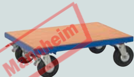
④ mit MDF-Platte (bündig) 600 x 400 mm