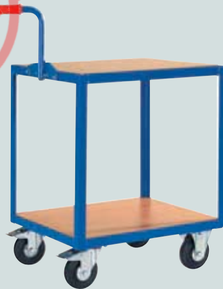
④ Griffroller 2-etagig Schiebegriff anschraubbar