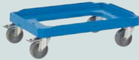
① ABS-Kunststoffrahmen 600 x 400 mm