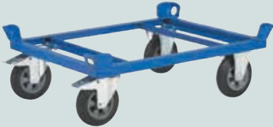
① Fahrgestell 800 x 600 mm Ladehöhe 270 mm