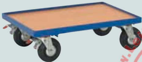
③ mit MDF-Platte (Rutschkante) 600 x 400 mm