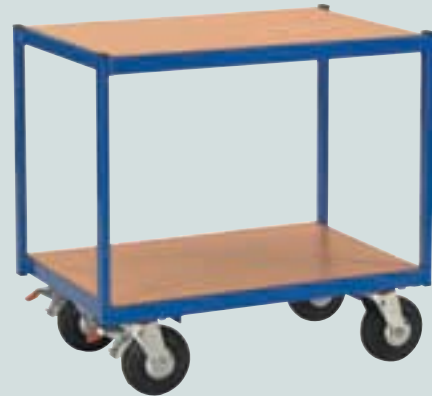
② mit MDF-Platte (bündig) 600 x 400 mm