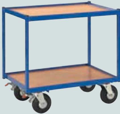
① mit MDF-Platte (Rutschkante) 600 x 400 mm