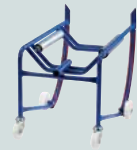
Standard mit Aufлагewalzen