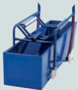
Mit Auffangwanne 213 Liter und Aufлагewalzen