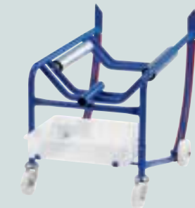
Mit Tropfwanne aus Polyethylen und Aufлагewalzen